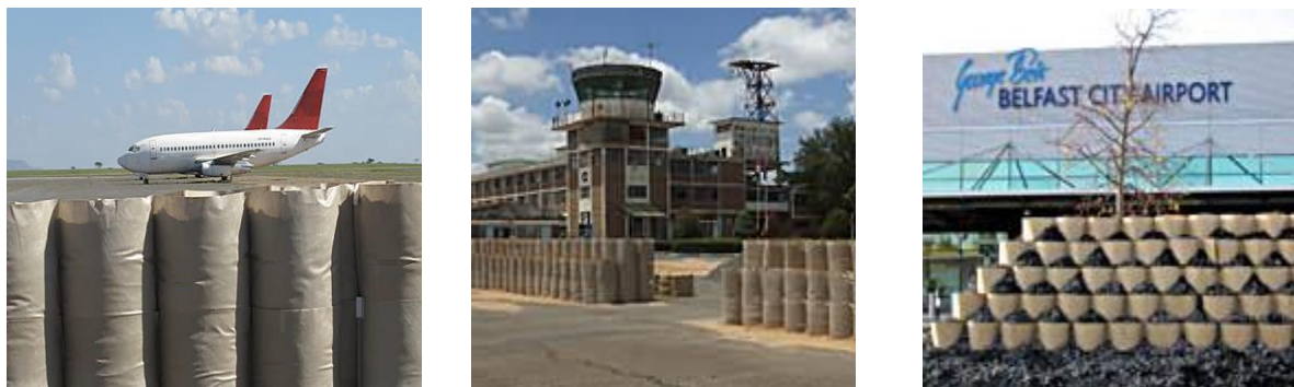
2. ábra Repülőtér fizikai védelme különböző DEFENCELL elemekkel [5]

megfelelő védelmi berendezéseket, amelyekkel kontrollálható a járművek sebessége, haladása. Ilyen berendezések lehetnek a forgalomlassító közlekedési folyosóban elhelyezett ún. fekvőrendőrök, a különböző típusú tüskés útzárak, az útpályából kiemelkedő oszlopok, a sorompók, illetve a katonai repülőterek esetében a HESCO bástyák. [2], [3], [4] Erre a célra alkalmazhatók a DEFENCELL eszközcsalád elemei is. Természetesen fel kell készülni arra az eshetőségre is, hogy a robbanószerkezetet mégis sikerül bejuttatni a repülőtér területére. A fontosabb létesítményeket és a repülőeszközöket ezért fizikailag is óvni kell a robbantás okozta káros hatásoktól (léglökés, repeszek).