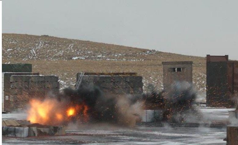
5. ábra A MAC® gabion elemek tesztelése robbantásra [5]