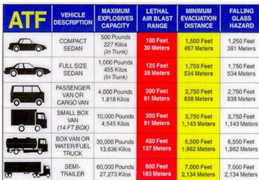
1. ábra Különböző járművekben elhelyezhető IED és hatásai [1]

Statikus célpontok ellen (pl. egy repülőter, tábor, épület, létesítmény, stb.), amikor nagyobb tömegű robbanóanyag szükséges a romboláshoz, valamilyen járműben elrejtett IED-t alkalmaznak (VBIED 4 ), és igyekeznek vele a lehető legideálisabb közelségbe kerülni vagy bejutatni azt a célként kiválasztott objektum területére. Attól függően, hogy milyen jellegű a létesítmény szerkezete, mennyire közelíthető meg és mekkora károkat terveznek okozni, különböző típusú és nagyságú járműveket használhatnak, melyek mérete behatárolja a robbanóanyag tömegét, ezzel egyetemben a veszteségokozás rádiuszát.