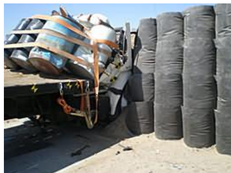
4. ábra DEFENCELL elemek tesztelése járművekkel [5]