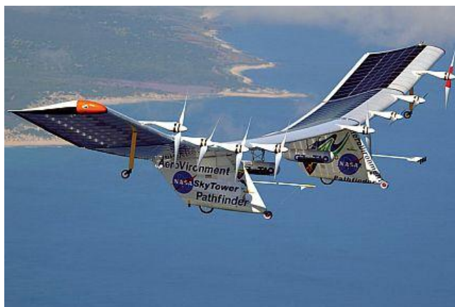
7. kép A „Pathfinder” elérte a 24470 méteres magasságot [10]

A „nagyon nagyok” összehasonlíthatatlanul jobb körülmények között, a legújabb anyagok és technológiák birtokában – az űrtechnika színvonalán – fejlesztik a jövő elektromos repülőit. A több kutató fejlesztő intézet erőforrásaival – NASA támogatással – épülő napelemes repülőgépek sorra döntögetik a táv-, időtartam-, magassági rekordokat. A Pathfinder, Centurion, Helios nyitotta a sort, a „nappali repülésben” pilóta nélküli (Unmanned Air Vehicle – UAV) változatokkal.