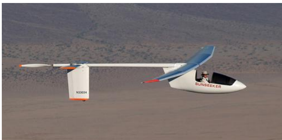
3. kép „Sunseeker II” napenergiát használó, pilótával repülő motoros vitorlázó [5]

Rochelt tervezte az első sikeres, emberi erővel hajtott repülőgépet is. Ebben az „iskolában” tanulta meg az igazi könnyű szerkezetek titkát és kapott kedvet a „nappal repüléshez” a műrepülő bajnok Eric Raymond is, aki később megépítette a maga „SunSeeker”-eit. [4] A 247