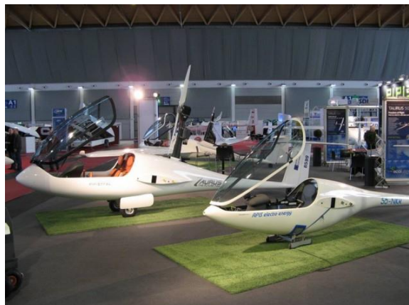
5. kép A Pipistrel gyár két elektromos hajtású modellje a Taurus és az Apis Electro Bee

Roman Sušnik munkássága is tanulságos. Először vett egy APIS ultrakönnnyű vitorlázót KIT-ben és 2004-ben a friedrichshafeni kiállításon – a „nagyok” mellett – megjelent a kefes motorú APIS EA1-el. Szorgalmasan dolgozott a motor továbbfejlesztésén és 2008-tól már a kefe nélküli EMRAX motorokat gyártja olyan sikerrel, hogy a „nagyok” is tőle vásárolnak. A Pipistrel gyár kétszemélyes Taurusa – az idei friedrichshafeni egyik díjazott – a DG Flugzeugbau és a már a Cessna Aircraft is az Ő motorjait próbálgatja. Több európai egyetemi kutatást/fejlesztést is ellát motorokkal, ahol a hajók, autók elektromos hajtásán dolgoznak.