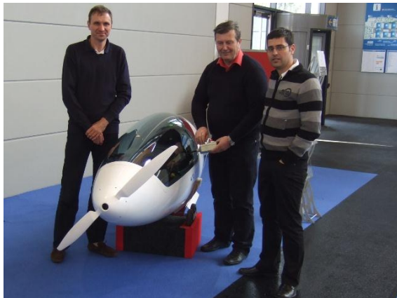
6. kép FES az Aero 2010 –en mutatkozott be Friedrichshfenben [8]

apja Matija Žnidaršič ragyogó megoldásával a FES – Forward Electric Sustainer – azóta már önálló feszállást is bemutató – elektromos hajtással. Mindketten a modellezőként kezdték, majd a vitorlázó repülés következet és a több-ezer óra tapasztalat után a litván LAK-17B villamosítósa meghozta a sikert, a gép a patinás „Sportine Aviacija” gyár élvonalbeli terméként vált.