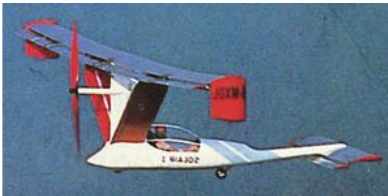
2. kép A Solar 1 már 1979-ben napenergiával repült [3]

Az első rekordot – 4 óra 41 percet levegőben töltő – napelem hajtású repülőgépet Günter Rochelt professzor alkotta, amely formáját tekintve is szokatlan Canard 2FL ultrakönnnyű vitorlázó gépre épült és mindenképpen inspiráló volt a további fejlesztésekhez