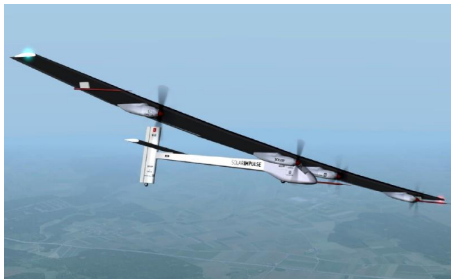
8. kép A „Solar Impulse” 2011. májusban már megtette a Brüsszel-Párizs távolságot [12]

vezett kabin berendezése – a tömeg csökkentése érdekében – meglehetősen spártai. A fejlesztők terve, hogy 2013-14-ben, öt állomás közbeiktatásával körberepüljék a Földet. [11]