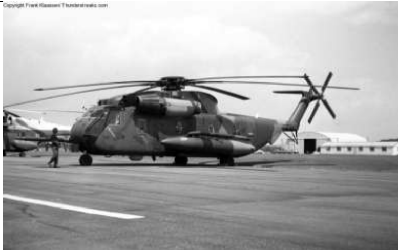
HH-53 „Super Jolly”

Mint minden új technikai eszköznél, a HH-53-nál is előfordultak kezdeti nehézségek. Annak ellenére, hogy a helikopter alkalmas volt légi utántöltésre, nem tudott folyamatosan járőrözni, mivel a másod helikoptervezetők nem kaptak kiképzést légi utántöltésre. A mechanikai problémák közül gyakori volt a forgószárnyagy olajszivárgása, a hajtómű indítórendszerének, valamint az olajhűtő ventilátor csapágyának meghibásodása.