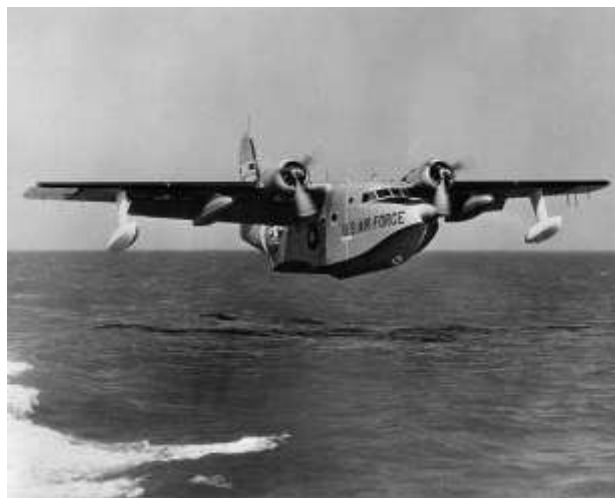
HU-16-os kételtű repülőgép

A HU-16-os vízi leszállásra is alkalmas repülőgépet gyakran használták vízről történő mentésekhez, annak ellenére, hogy elektronikai berendezései csak korlátozottan voltak alkalmasak kutatásra és túlélő képessége nem tette lehetővé a Vietnám feletti alkalmazást.