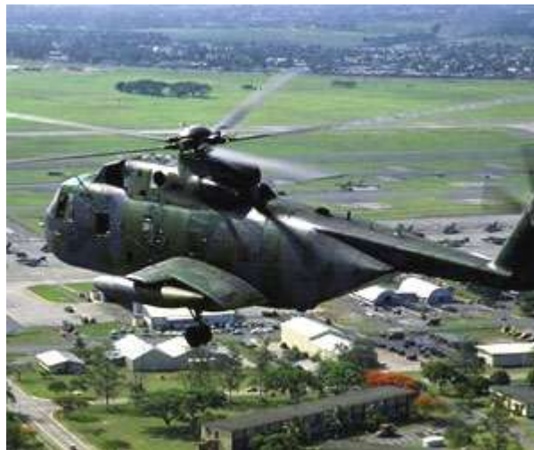
HH-3 „Jolly Green”

1964 végére az észak-vietnámi légvédelmi tüzérség jelentős fejlődésen ment keresztül és nyilvánvalóvá vált, hogy a HH-43F már nem képes feladatát hatékonyan ellátni a megváltozott körülmények között. A bevetések számának folyamatos növekedése és a megnövekedett veszélyeztetettségi szint miatt a Légimentő Szolgálat 15 darab HH-3 helikoptert kért a HH-43-asok leváltására. A HH-3 beceneve „Jolly Green” lett és a CH-3-as szállítóhelikopter speciálisan kutató-mentő feladatokra átalakított változata volt. A módosítások tartalmazták az erősebb hajtóműveket, a helikopter páncélozását, megnövelt méretű üzemanyag tartályokat, törhetelen üvegezést és a nagyobb teherbírású csörlő berendezést. A helikopter repülési sebessége 30 százalékkal meghaladta elődjét. Az átalakítási munkálatok és a személyzetek kiképzése időigényesnek bizonyult, ezért az első HH-3-as 1965 novemberében állhatott szolgálatba. [16]