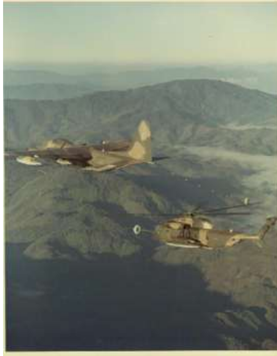
HH-53 „Super Jolly” légi utántöltése

A légi készenlétből mentésre induló helikopter személyzetének gyakran ki kellett engedni az üzemanyagot, ahhoz, hogy a gép eléggé könnyű legyen a magashegyi viszonyok közötti mentéshez, és kiemeléskor képes legyen függési magasságát tartani. A légi utántöltés lehetősége nélkül az üzemanyag kiengedése után nem tudtak volna visszajutni baráti területre, vagy ha a visszajutáshoz elég kerozint tartalékoltak, akkor a kiemelés során fel kellett vállalniuk a körülményekhez képest túl nehéz helikopterrel való munkát, mely gyakran vezetett balesethez. [36]