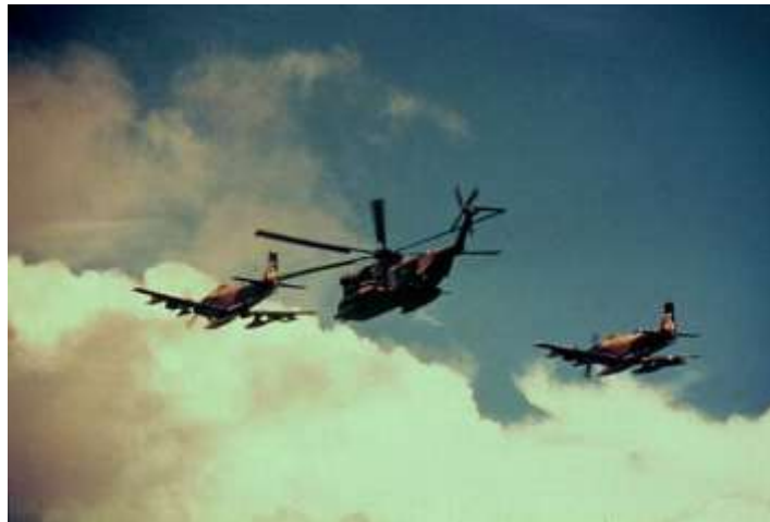
HH-53 „Super Jolly” kísérése A-1 Skyraider géppárral

Időközben a T-28 leváltására a hadszíntérré érkezett az A-1 Skyraider. A repülőgép gyorsan bebizonyította, hogy hatékonyabb elődjénél közvetlen légitámogatás, valamint a légi lefogás szerepkörben és ráadásul harcászati technikai adatai alapján a kutató-mentő kíséret feladatára is kiválóan alkalmas volt. [24]