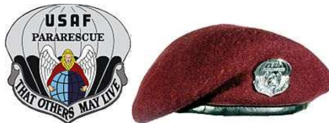
Kutató-mentő ejtőernyős sapka jelvénnel

Az első mentés óta számtalan pilóta, katona és civil tapasztalta meg személyesen, hogy baj esetén a kutató-mentő ejtőernyősök készen állnak a segítségnyújtásra. Vietnámban nap, mint nap kockáztatták életüket, hogy elsők lehessenek, aki a túlélőnek reményt, esélyt ad a megmenekülésre. Különleges képességeik, kiváló kiképztségük elismeréseként 1966-tól barnászörös sapkát hordanak, melyet a kutató-mentő ejtőernyős jelvény ékesít. A sapka színe jelképezi a vért, amit hullatnak társaik megmentése érdekében, és az elkötelezettséget hivatásuk iránt. [33]