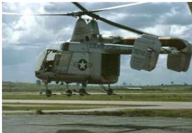
HH-43 Huskie helikopter

A Délkelet-Ázsiába érkező alegységek a HH-43 Huskie helikopter módosított változatával, a HH-43F-el voltak felszerelve. Az átalakítást a hadszíntér harcászati követelményei indokolták. A HH-43F 1150 lóerős gázturbinás hajtóművel volt felszerelve, amely 400 lóerővel erősebb volt az alap változatnál. Megnövelt, 350 gallonos 7 , sérülés esetén önzáró üzemanyagtartályával a helikopter harcászati sugara 75-ről 120 8 mérföldre emelkedett. Túlélő képességét kb. másfél centiméter vastag páncéllemez biztosította a pilótafülke és a hajtómű körül, valamint új rádiókat is beépítettek a kommunikációs lehetőségek bővítésére. [11]