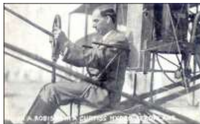
Hugh Robinson hidroplánjával

Az első repülőgéppel végrehajtott mentést Hugh Robinson hajtotta végre 1911-ben, amikor hidroplánjával leszállt a Michigan tavon, hogy kihúzza a vízből egy lezuhant gép pilótáját. [1]