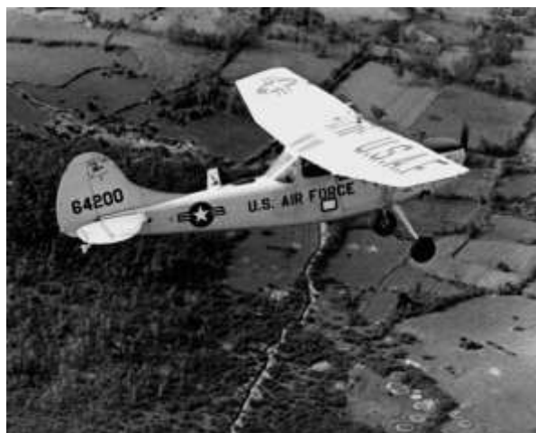
Cessna O-1-es „Bird Dog”

A repülésirányítók általában a Cessna O-1-es „Bird Dog” repülőgépet használták, amelyek békeidőszakban főleg kiképzőgépként szolgáltak. A vietnámi háborúban gyakran használták felderítő és légiirányító szerepben, mivel relatíve kicsi volt és emiatt nehéz volt a földről eltalálni. A gépet általában tapasztalt vadászpilóta vezette, aki adott földrajzi terület megfigyeléséért volt felelős, így könnyen azonosította az ellenséges tevékenységet. A megtalált földi célpontokat foszforos rakétával jelölte meg, melynek füstjét könnyedén azonosították az érkező harci gépek. [30]